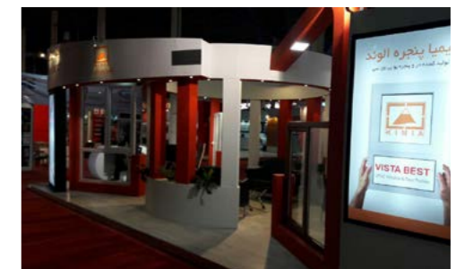
کیمیا پنجره الوند