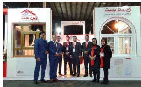
دایا صنعت ارجمند (وین ست)

حضور پنجره سازان طرف قرارداد ویستابست در نمایشگاه های مرتبط در سراسر ایران، بار دیگر نام آشنای این مجموعه را در جمع دیگر همکاران این صنعت پر رنگ تر نمود.