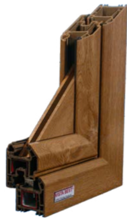
30. Winchester XA

ویستا بست جهت پاسخ به نیازهای روزافزون بازار محصول جدیدی را به سبد روکش های لمینیت، مطابق با استانداردهای روز اضافه نمود تا بتواند پنجره ای، شایسته ساختمان شما در طرح های چوب و رنگ های مختلف به صورت تک رو یا دو رو لمینیت به همراه ضمانت نامه بیمه آسیا را تقدیم نماید.